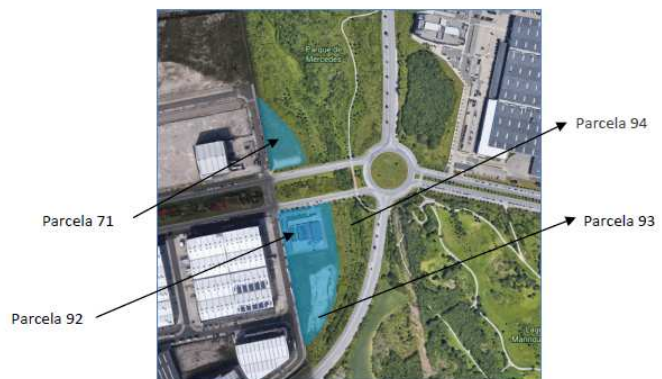
Ilustración 2 ámbito de la modificación y ubicación de las parcelas